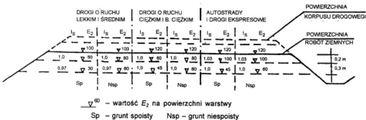
Rys. 1. Wartości wymagane w podłożu wykopów: wskaźnika zagęszczenia I_s i wtórnego modułu odkształcenia E_2 [1].

Wykonawca powinien skontrolować wskaźnik zagęszczenia gruntów rodzimych, zalegających w strefie podłoża nasypu, do głębokości 0,5m od powierzchni terenu. Jeżeli wartość wskaźnika zagęszczenia I_s jest mniejsza niż określona w tablicy 2, Wykonawca powinien dogłębić podłoże tak, aby powyższe wymaganie zostało spełnione. Jeżeli wartości wskaźnika zagęszczenia I_s określone w tablicy 1 i na rys 1. nie mogą być osiągnięte przez bezpośrednie zagęszczanie podłoża, to należy podjąć środki w celu ulepszenia gruntu podłoża, umożliwiające uzyskanie wymaganych wartości wskaźnika zagęszczenia I_s .