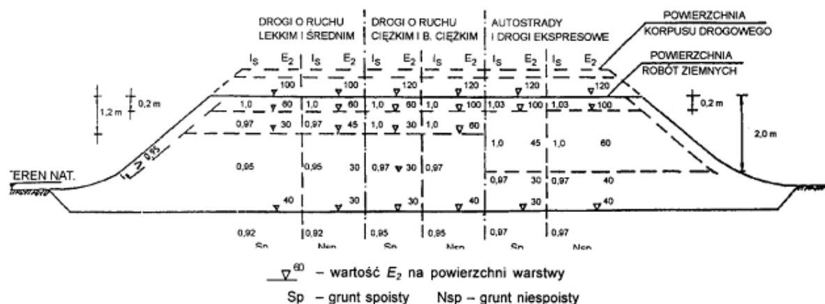
Rys. 1. Wartości wymagane w nasypach: wskaźnika zagęszczenia I_s i wtórnego modułu odkształcenia E_2 , w [MPa], wg [1].

Jako zastępcze kryterium oceny wymaganego zagęszczenia gruntów dla których trudne jest określenie wskaźnika zagęszczenia I_s , przyjmuje się wartość wskaźnika odkształcenia I_0 , wyznaczanego jak określono w punkcie 1.4.3.